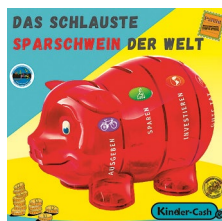
Kinder-Cash Das Sparschwein mit vier Abteilen