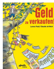
Geld zu verkaufen Kinderbuch