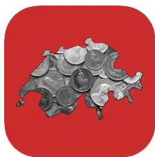
Budget CH Budgetberatung Schweiz