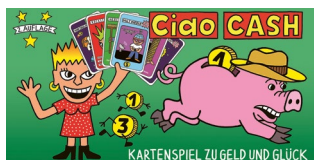
Ciao Cash Das Spiel um Glück und Geld